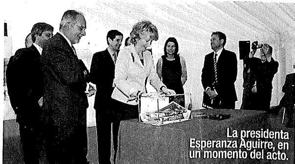
La presidenta Esperanza Aguirre, en un momento del acto.

sede de la Thyssenkrupp. Estas iniciativas posibilitarán que Móstoles cree en los próximos años